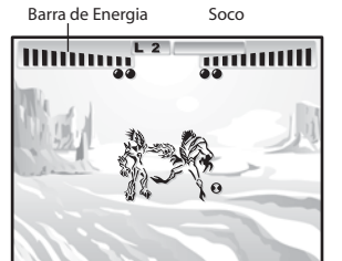
Fogo Fátuo ícone Highbreed BEN 10